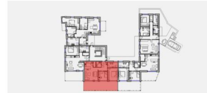
GRUNDRISS EBENE 1 M 1:1500